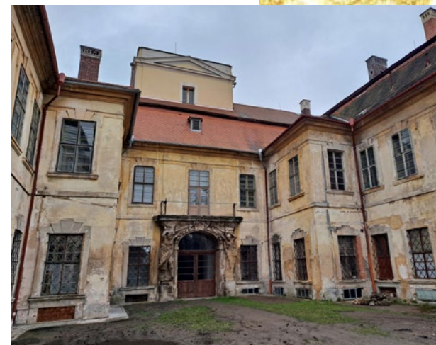
zámek v Křimicích, historické foto, současné foto zámku