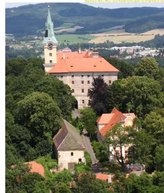
zámek Zelená Hora

Od roku 1992 je zámek Zelená Hora ve vlastnictví obce Klášter, která pro něj hledá vhodné využití. V poslední době se především díky aktivitě Plzeňského kraje snad přece jen začalo blýskat na lepší časy, avšak cesta k opravě zámku a jeho plnohodnotnému otevření bude velmi náročná a dlouhá. Proto se Plzeňská filharmonie rozhodla ve spolupráci s Pamětí národa, obcí Klášter a městem Nepomuk výše uvedený záměr podpořit a ve veřejnosti tak oživit i povědomí o Zelené hoře jako místě s neopakovatelným geniem loci, kudy kráčely dějiny českých zemí a kde naši předkové zanechali nesmazatelné stopy, které stojí za to objevovat.