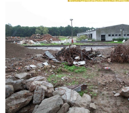
demolice vepřína, 2022