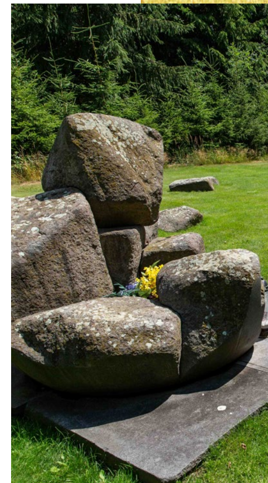
kulturní památka Lety

Na území protektorátu Čechy a Morava existovaly dva tzv. cikánské tábory: kromě Letů u Písku ještě v Hodoníně u Kunštátu na Moravě. Byly zřízeny v srpnu 1942 na místě původních kárných pracovních a později sběrných táborů. V neutěšených životních podmínkách zde byli drženi nejen muži, ale také ženy, děti, staří a nemocní lidé. Jednalo se o přestupní stanici před transportem do koncentračního a vyhlazovacího tábora Auschwitz II-Birkenau. Tímto táborem prošlo více než 22 000 Romů, z nichž téměř 20 000 nepřežilo. Romové z protektorátu přitom tvořili druhou nejpočetnější skupinu. Ostatně z koncentračních táborů a dalších represivních zařízení se po porážce nacistic-