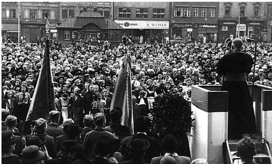
Arcibiskup Josef Beran na návštěvě své rodné Plzně v roce 1947.

V exilu vykonal mnohé pro naše krajany i katolíky za železnou oponou. Zemřel 17. května 1969 v Římě. Beranovy ostatky spočinuly v kryptě baziliky sv. Petra ve Vatikánu. Jejich repatriace se uskutečnila až v roce 2018. Naplnila se tak poslední vůle kardinála Berana. V průběhu oslav návratu jeho ostatků si český národ připomněl i Beranovy osobní kvality a postoje, které ho dostaly do konfliktu s totalitními režimy. Z těchto střetů vyšel jako morální autorita působící daleko za hranicemi své církve a vlasti.