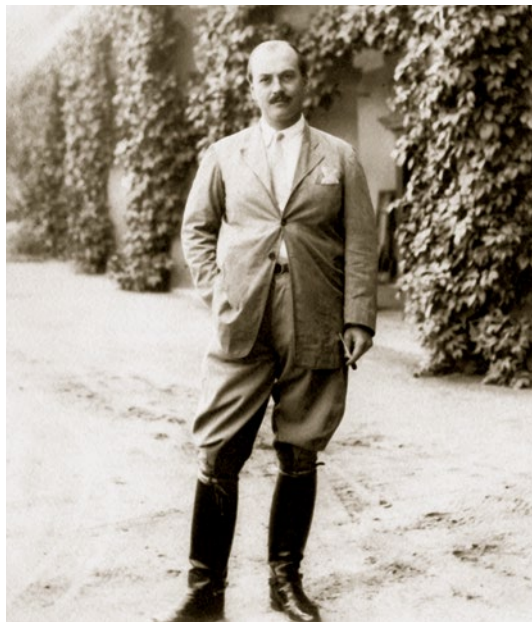
Všechny tři deklarace české šlechty podpořil i hrabě Rudolf Theobald Czernin z Dymokur, dědeček současného senátora Tomáše Czernina.

Zároveň je třeba konstatovat, že se jednalo o názory, které reprezentovaly smýšlení pouze asi jedné třetiny šlechty. Většina aristokratů z českých zemí se přikláněla k německví, přičemž mnozí z nich otevřeně podporovali sudetoněmecké hnutí a nacistickou politiku směřující ke zničení Československa. Avšak o to více si jednání těch šlechticů, kteří se postavili za obranu státu a přihlásili se k češtví, zaslouží pozornost i obdiv. Ostatně toto rozhodnutí mělo pro jednotlivé osobnosti urozeného původu a pro jejich rodiny neblahé důsledky. Na jejich majetky nacisté uvalili nucenou správu nebo je rovnou konfiskovali. Několik šlechticů bylo za své protinacistické postoje a aktivity uvězněno, někteří v důsledku toho zemřeli, či dokonce byli popraveni.