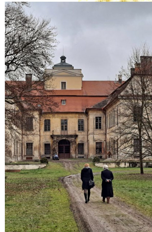
Křimice, současnost