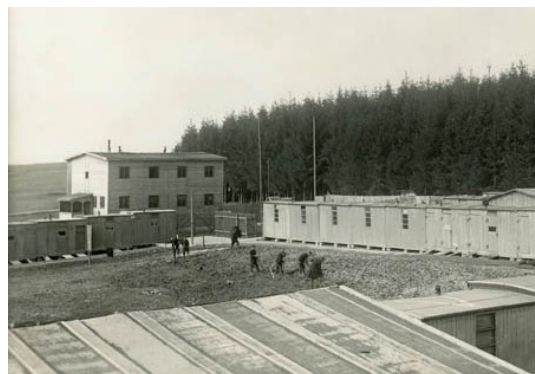
dobová fotografie 1942–1943