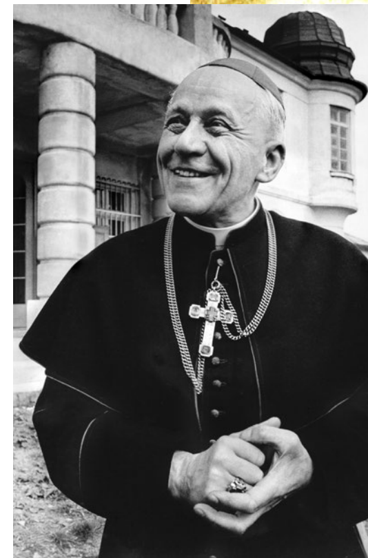
arcibiskup Josef Beran (1888–1969)

V čele domácí římskokatolické církve stál i po Únoru 1948 a statečně odolával pokusům komunistů o její ovládnutí. Nakonec se 19. června 1949 ocitl v internaci, v níž prožil pod stálým dozorem StB dlouhých 16 let.