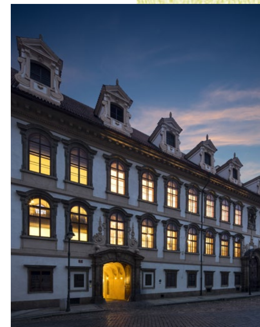
Senát Parlamentu České republiky