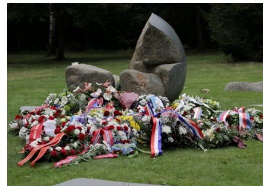
pietní akt, Památník Lety