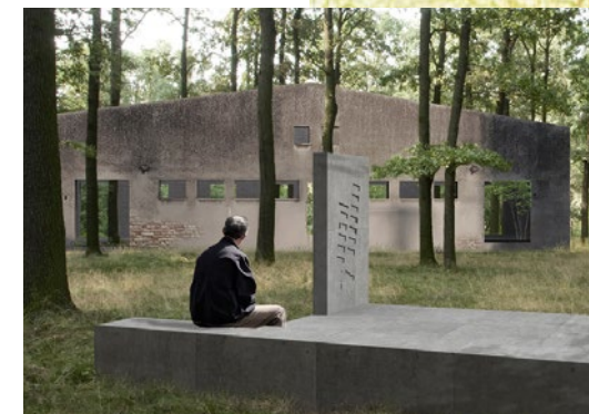
vizualizace projektu Památník Lety