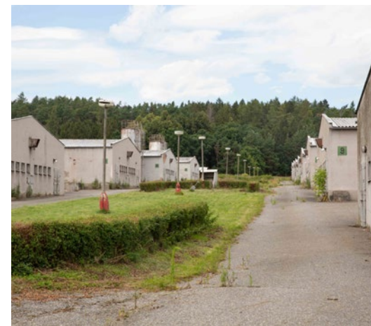
bývalý objekt velkokapacitního vepřína na místě sběrného tábora