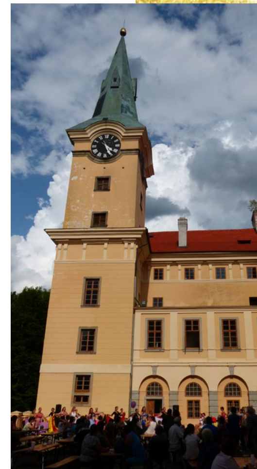
zámek Zelená Hora