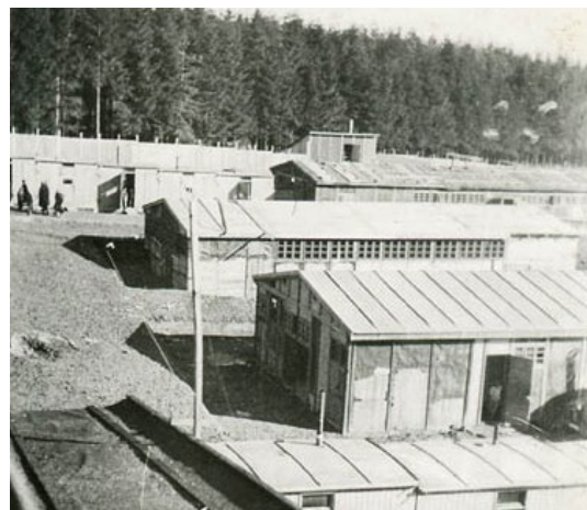
dobová fotografie 1942–1943

https://www.rommuz.cz/cs/lety-u-pisku/historie/predvalecna-doba-a-obdobi-valky/